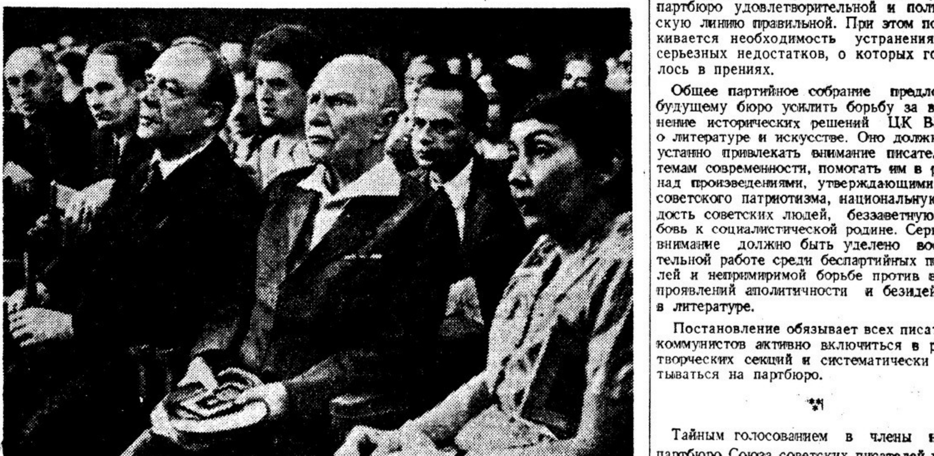
Отчетно-выборное собрание парторганизации ССП СССР. НА СНИМКЕ: в зале заседания.

Депутаты и гости в едином порыве встали и устремляют бурную овацию в честь товарища Сталина и его верных соратников. В течение нескольких минут длится горячая овация. Собиравшиеся выражают любовь и преданность товарищу Сталину, великому вождю и полководцу, организатору исторических побед советского народа.