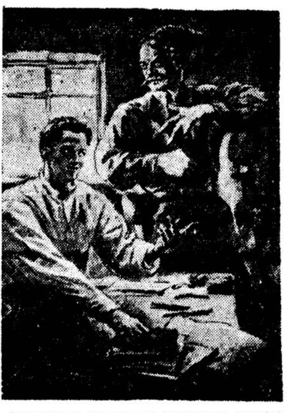
Гослитиздат выпускает в 25-летие Октябрьской революции классическую и советскую литературу...

Сложный и трудный путь лежит перед этим подростком. Великое множество дел осталось на его долю: ему придется и строить и отстаивать построенное. И книги свои мы судим, помня об этом подростке, и разбираем: помогут они ему или не помогут?